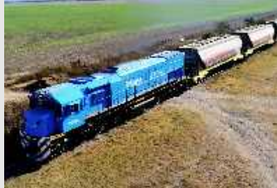
Reducción de costos logísticos y operativos