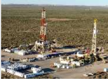
Mayor eficiencia en la explotación de Vaca Muerta