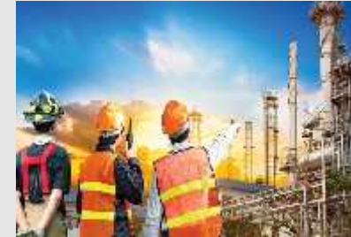
Empleo de Calidad