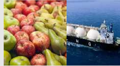
Aumento de exportaciones