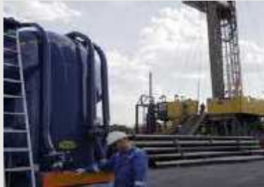
Abastecimiento eficiente de energía a la población argentina